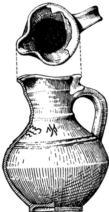
Кувшин из погребения в Раду-Негру.