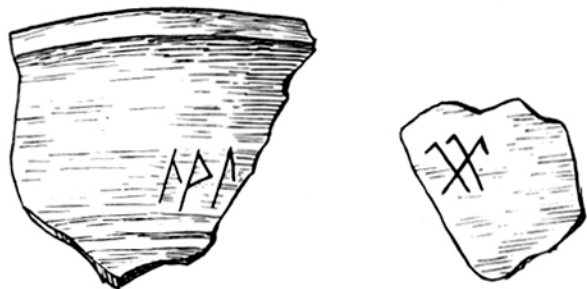
Обломки керамики из Лепесовки.