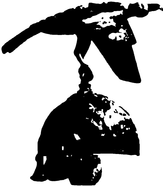
Навершие кельтского шлема из Чумешти (Румыния). III век до новой эры.

ны. И в этой связи обращает на себя внимание один из пассажей в «Естественной истории» Плиния Старшего: «В древности самым явным признаком победы считалась передача побежденными зеленого стебля. Она обозначала отказ от обладания землею, от пользования производящей и питающей силой почвы, даже от погребения в земле; этот обычай, как я знаю, до сих пор сохранялся у германцев».