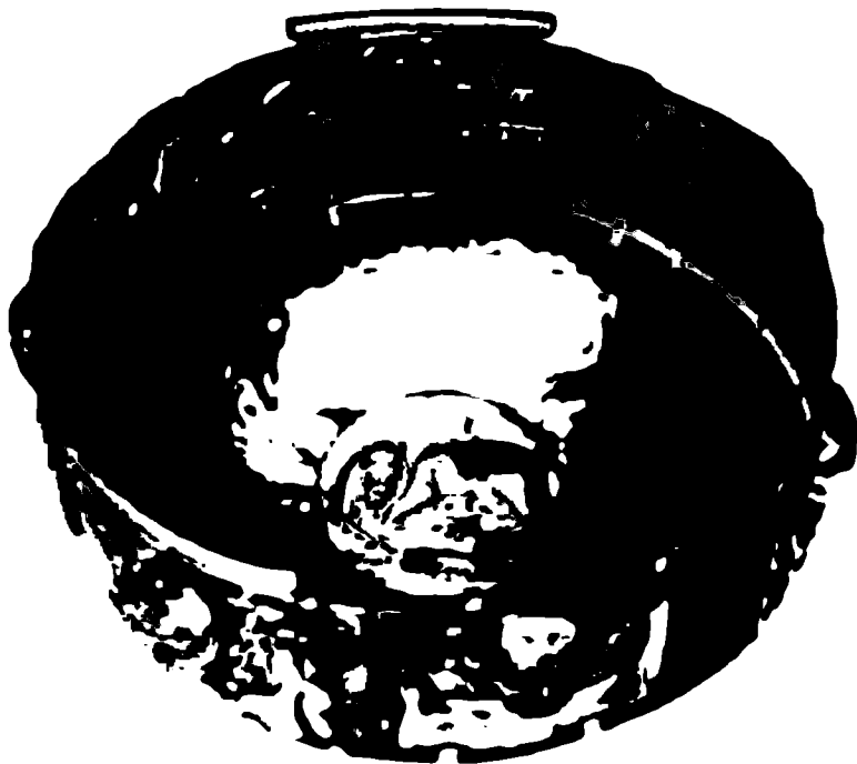
Котел из Гундеструпа (II—I века до новой эры).