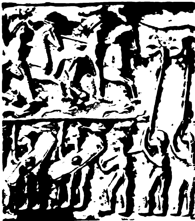
Изображения кельтских (кимврских?) воинов на котле.