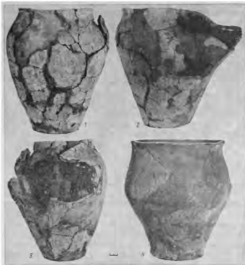
Рис. 1. Лепные сосуды из Лепесовки. 1—3—сосуд № 2701/404; 4 — сосуд № 2701/405

достаточно разбросанных и разнородных памятников конца I—II в. н. э. [23—26; 27, рис. 29—31, 39—43] от верховьев Днестра до Подесенья и верховьев Псла (Майдан Гологирский, Ремезивцы, Пидрижье, Рахны, Марьяновка, Лютез, Почеп, Синьково, Картамышево и др.). Он состоит из памятников, оставленных потомками носителей зарубинецкой культуры, разбитых в середине I в. н. э. сарматами, с включением элементов пшеворских и липицких на западе и юхновских на востоке [28, с. 69, 74, 77]. Правобережные памятники этого рода В. К. Воляник объединял в «тип Пидрижье», взяв в качестве эталона пшеворско-зарубинецкое поселение на Волыни [29, с. 10—11].