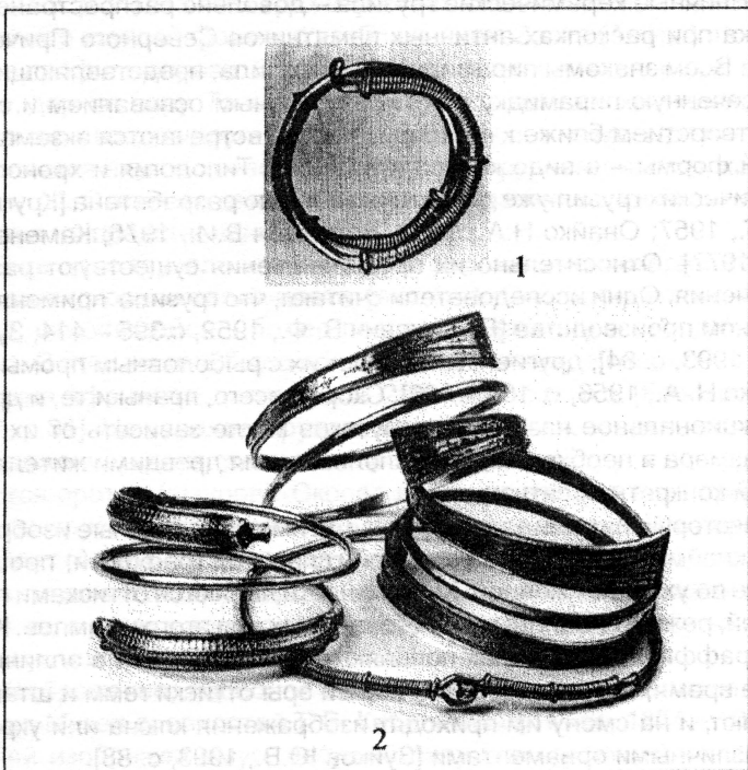
Рис. 2. Находки золотых гривен на островах Балтийского моря (по Andersson, 1993 и Andersson, 1995).