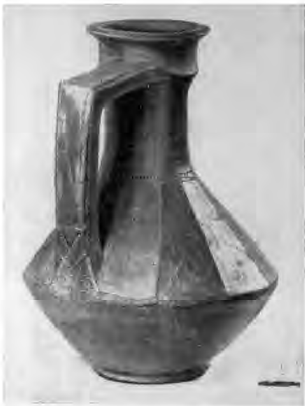
Рис. 1. Кувшин из погребения в с. Дубяги

1. Кувшин на кольцевом поддоне с биконическим гра-ненным туловом, высоким уз-ким горлом и ручкой, согну-той под прямым углом. По-верхность лощеная, черного цвета. Ручка, грани тулова и ребристый выступ на горле украшены пунктирными ли-ниями. Диаметр горла 8,4 см, высота общая 22,2 см (рис. 1).